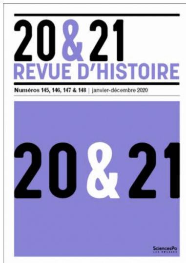
Le dernier numéro de la Revue d'histoire 20 & 21

Que veut dire stabilité dans un pays où l'armée française est présente quasi sans interruption depuis son indépendance ? » La chercheuse a finalement développé ses propres questions, portant notamment sur la violence subie par les civils et en particulier les femmes, au Tchad.