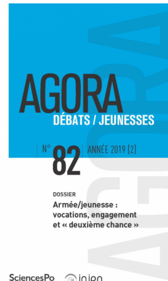
Le dernier numéro de la Revue Agora