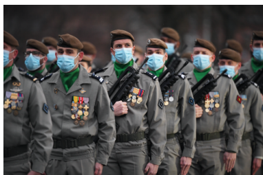
Des soldats du 2e régiment de hussards lors d'une cérémonie en hommage à deux soldats de l'opération Barkhane tués peu avant au Mali, le 8 janvier 2021 à Haguenau.