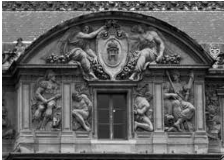
Fig. 4. Détail des trophées de l'attique du Louvre de Lescot, Paris.