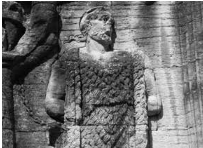
Fig. 3. Détail des captifs de l'Arc de Carpentras.