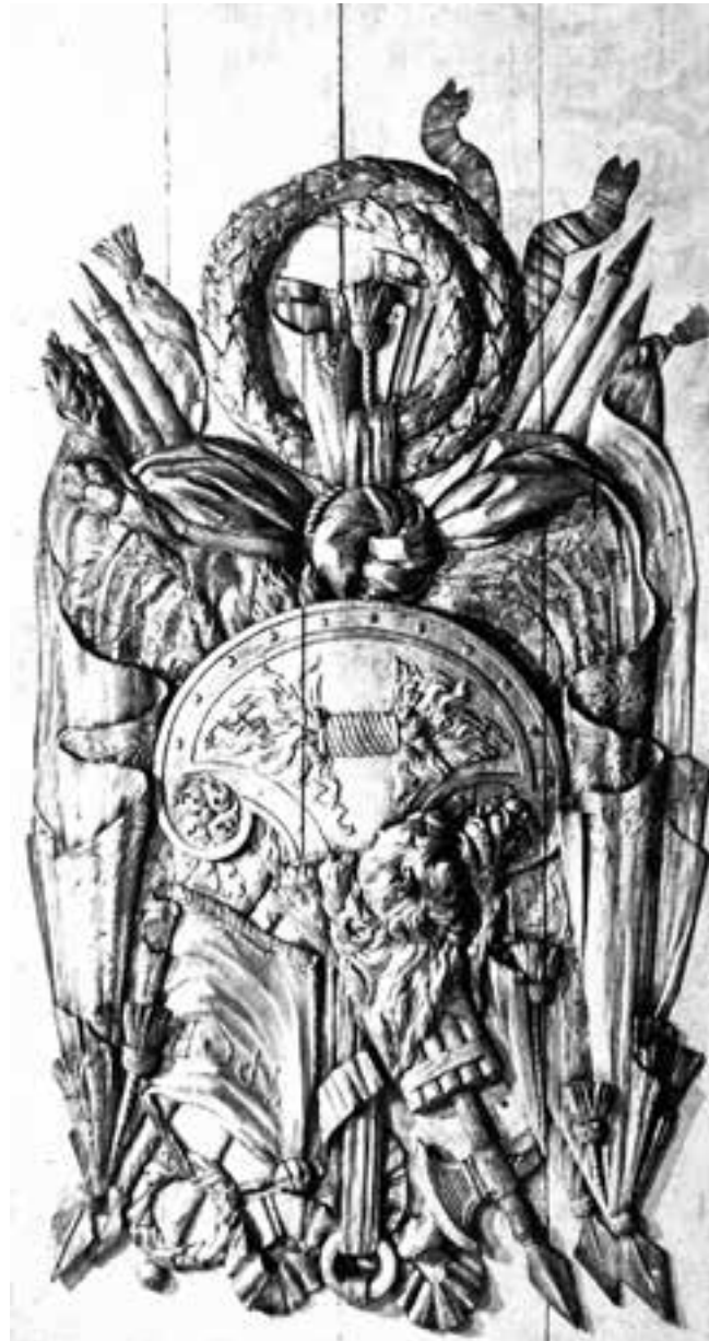
Fig. 5. Nicolas Ledoux, détail d'un des trophées du Café militaire , 1762. Musée Carnavalet, Paris.

d'antiques, les bibliothèques ainsi « qu'une multitude d'ouvrages anciens d'un style comme d'une écriture barbares », l'utilisation de ce qu'il appelle « les meubles guerriers » lui paraît en définitive assez peu pertinente. Son premier argument est le manque de véracité historique de la plupart des armements figurés qu'il juge « différents des réels ». Son second argument est la déperdition du sens originel, que ces objets ne véhiculent plus ouvertement : « De quoi en effet [les armes] seraient-elles représentatives ? Serait-ce des hommes auxquels on les attribue ? Serait-ce des armes dont ils se sont couverts dans les combats ? » Enfin, il critique leur efficacité en tant qu'objets de glorification et de mémoire, suggérant combien d'autres formes de commémoration sont plus appropriées : « Mais lorsqu'on veut transmettre à la postérité le souvenir d'un héros, c'est par un buste, c'est par une statue, c'est par un arc de triomphe chargé d'inscriptions, enrichi d'emblèmes, décoré d'images [...] que l'on procède ».