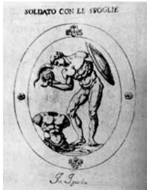
Fig. 1. Giovanni Battista Galestruzzi, Soldato con le spoglie , gravure sur cuivre, v. 1630.

taire, mais également comme un espace physique et mémoriel d'inspiration urbaine et architecturale 4 . Alors que l'influence de la castrametation militaire et de la structuration des camps militaires a souvent été liée à la création de villes, le champ de bataille a rarement été considéré en tant qu'objet architectural et urbain. Pourtant, comme le rappelle Strabon, le camp militaire fortifié ne pouvait être comparé à une ville. Il note ainsi dans la Géographie combien Posidonius s'amuse de Polybe « chiffrant à 300 les villes détruites par Tibérius Gracchus et lui reproche d'avoir voulu flatter celui-ci en appelant villes de simples camps fortifiés, comme on le fait dans les défilés du triomphe 5 ». Cette pique moqueuse de Posidonius n'en souligne pas moins la fortune du camp romain, mobile et éphémère, en tant qu'instrument de triomphe dans le cortège du vainqueur. Dans cet ordre d'idées, comment ne pas envisager que le lieu du triomphe guerrier, le champ de bataille foulé par les armées, ait pu lui-même nourrir le triomphe ? Empruntant ce fil conducteur, plusieurs pistes de recherche sont envisageables. La première s'intéresse à la fortune du lieu, explorant comment le sol sur lequel prirent place les batailles a pu être pérennisé et mémorialisé. La seconde s'intéresse à la transposition dans l'espace urbain du champ de bataille, ce terrain d'af-